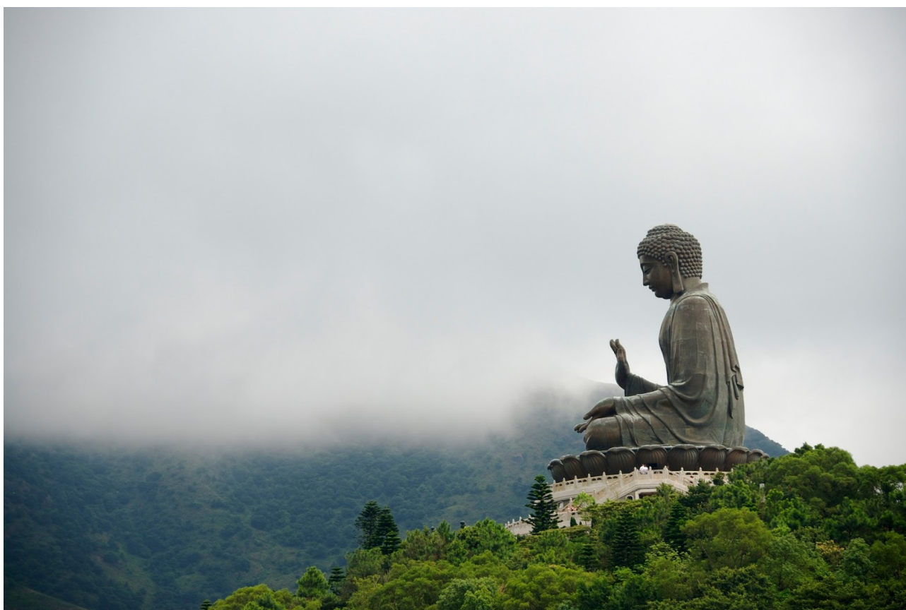
Buddha Amoghasiddhi, Lantau Island, Hong Kong

Contatti: claudia.baracchi@unimib.it r.fiume01@gmail.com