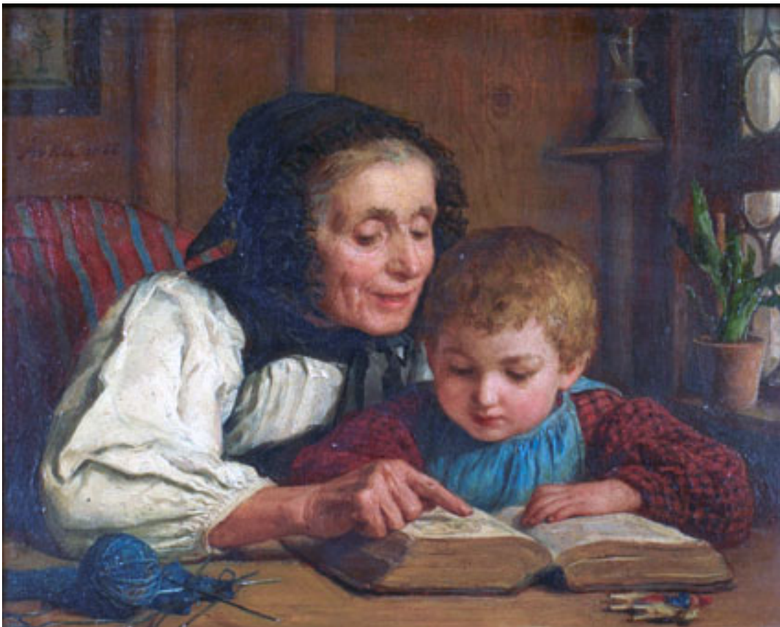
Das Bilderbuch , Albert Anker