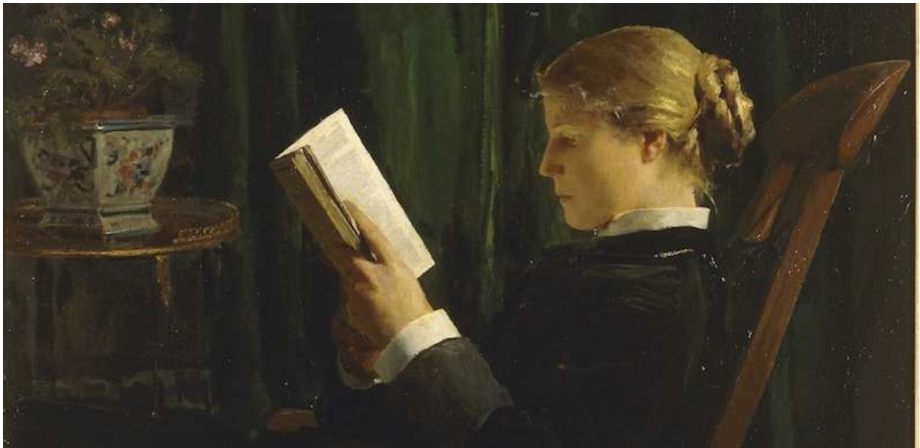
Albert Anker, La lisense