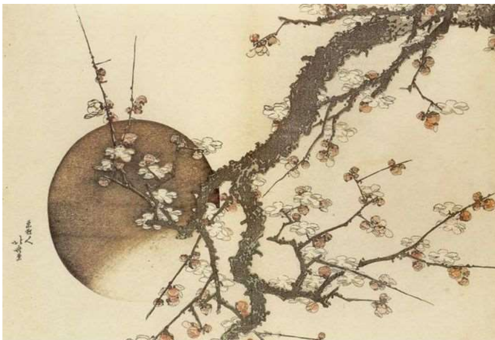
Hokusai, Susino e Luna

Contatto: alessandra.indelicato@unimib.it negronigi@libero.it